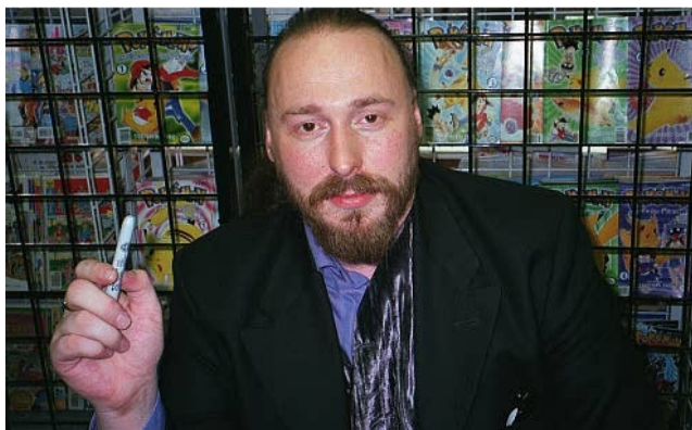
FIGURA 2: WARREN ELLIS SIGNING AT JIM HANLEY'S UNIVERSE, NYC/MANHATTEN. DOMINIO PÚBLICO. FOTO DE ROOTOLOGY