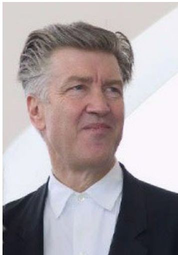
DAVID LYNCH EN CANNES 2001. COPYRIGHT © 2001 RITA MOLNÁR {{GFDL}}

(Revista Observaciones filosóficas , 2005)