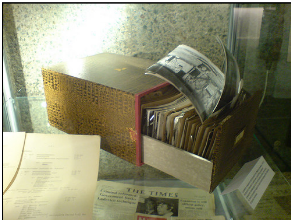
Figura 1: El “Barbican Arts Centre” de Londres mostro en el 2008 una serie de objetos personales de Stanley Kubrick. Esta caja de archivos contenía fotos de localizaciones como ideas para su película “Barry Lyndon”.

Idea- El imperio Romano en el espacio – Premisa – El bien triunfará sobre el mal ( Star Wars , Galáctica , Buck Rogers )